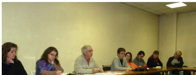
Dauphiné Libéré du 1 er décembre 2010 :

L'objectif des élus n'est donc pas d'imposer des solutions mais d'accompagner acteurs gérontologiques et porteurs de projets afin de mettre en oeuvre les mesures qui auront été jugées par tous les plus nécessaires et les plus efficaces.