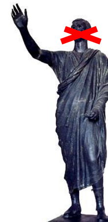
Statue en bronze d'un orateur 1er siècle avant J.C.

Mr le Maire, vice-président de la communauté de communes, lui a répondu en substance que les débats ayant lieu en commission (à condition qu'il y en ait!) le conseil communautaire était une assemblée délibérante qui ne devait que délibérer! Une assemblée délibérante qui ne fait que voter sans débattre est une chambre d'enregistrement. Le contraire de ce que doit-être une assemblée démocratique !